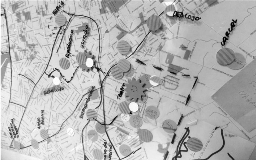
Cartografía de las desigualdades. Edición 2019.

El ejercicio culmina con un análisis conceptual, donde se ponen en juego los elementos que fueron haciéndose visibles en la superposición de capas y las aperturas conceptuales vistas durante el curso.