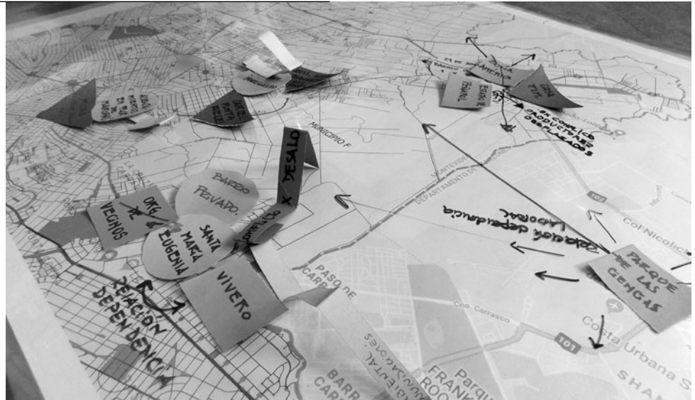
Fotografía de Cartografía de las desigualdades. Edición 2018.

Las “cartografías de las desigualdades” son cartografías sociales que hacen foco en la expresión de las desigualdades en el territorio. Las desigualdades son tomadas en un doble sentido: uno teórico, de asumir que en nuestras sociedades capitalistas los bienes materiales y simbólicos se distribuyen de manera profundamente desigual. Esto implica que no es posible pensar por ejemplo el “combate a la pobreza” si no es en relación a la redistribución de la riqueza. Y otro sentido, vinculado a