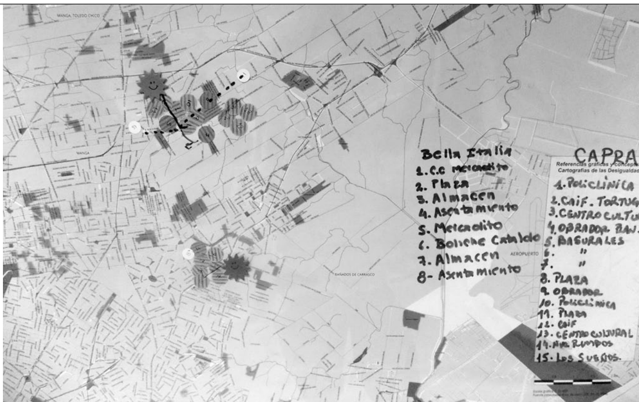
Fotografía de Cartografía de las desigualdades. Edición 2019.

es en muchas oportunidades un ejercicio novedoso, aún para aquellos que hace tiempo vienen compartiendo espacios a nivel territorial.